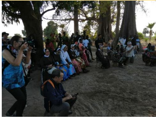
Festa delle Donne agricole – 09 febbraio 2020