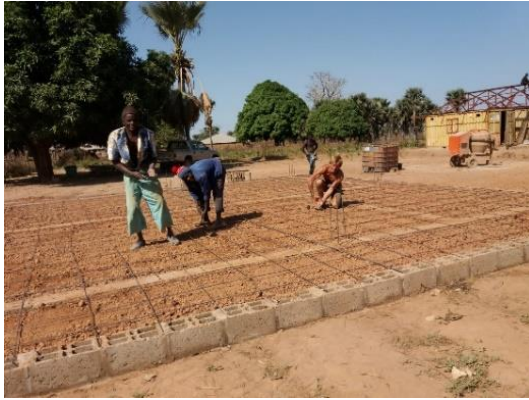
Armatura pavimentazione - gennaio 2019