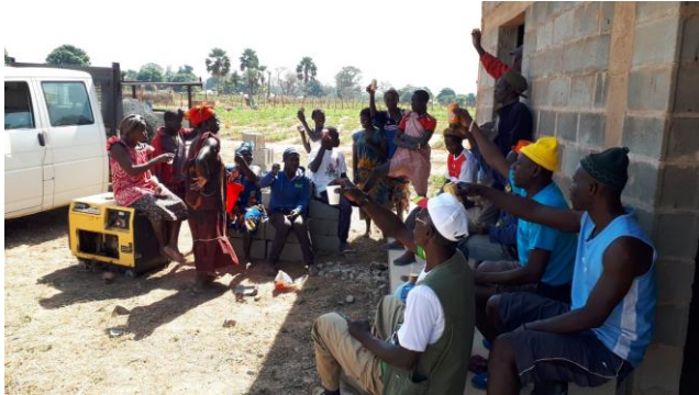
Pausa pranzo – gennaio 2020