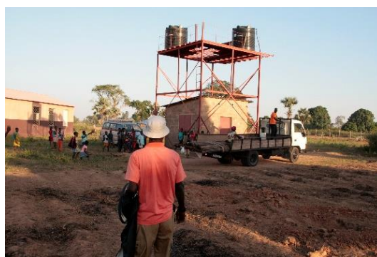
Arrivo materiale - gennaio- 2019