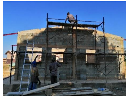
I lavori proseguono – dicembre 2019