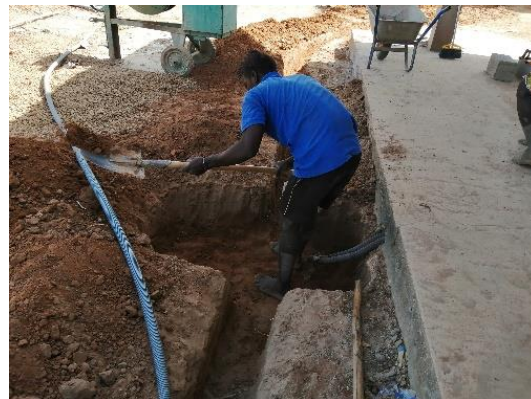
Pozzetto di servizio acqua energia elettrica -gennaio 2020