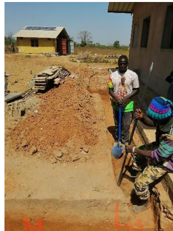
Scavo per scarichi nella fossa – gennaio 2020