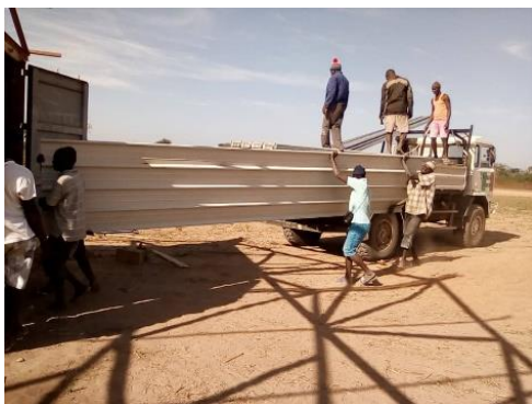
Arrivo materiale per la copertura – gennaio 2020