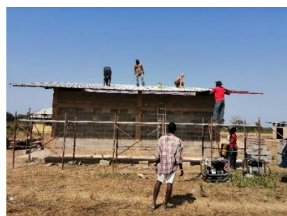
Copertura - gennaio 2020