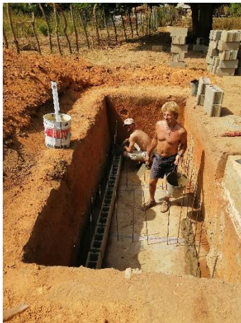
Armatura fossa biologica – gennaio 2020