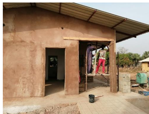
Intonaco esterno – gennaio 2020