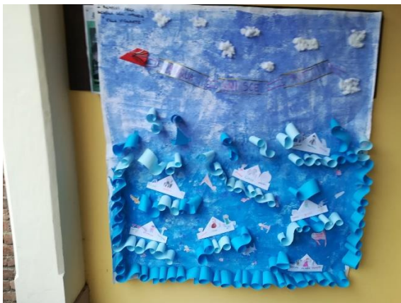
Centro Anziani Comune di Leini – dicembre 2019