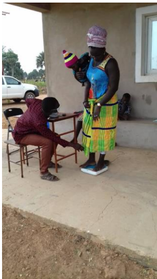
Presidio controllo peso – 26 marzo 2020