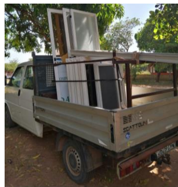
Serramenti – gennaio 2020