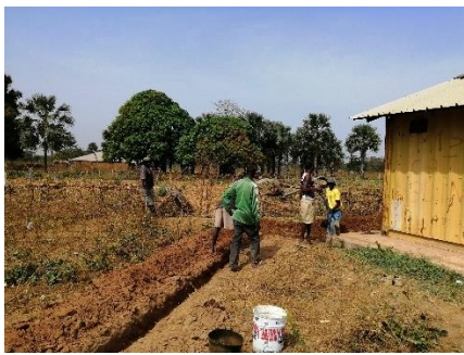
Scavo posa cavi energia elettrica – gennaio 2020