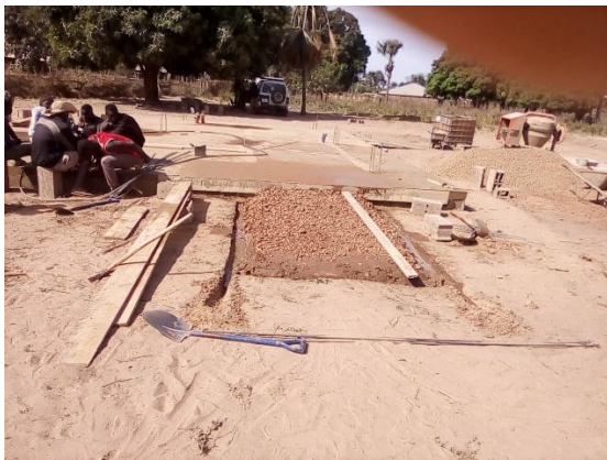
Pausa pranzo - gennaio 2019