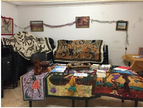
Centro Anziani Comune di Leinì – dicembre 2019