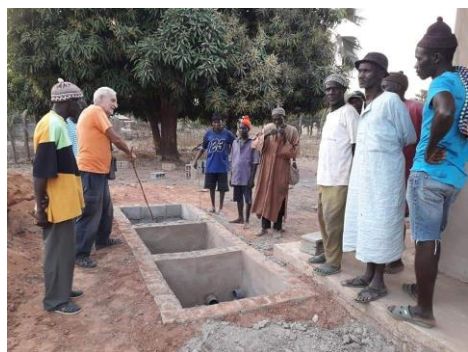
Informazione agli Uomini Grandi – 09 febbraio 2020