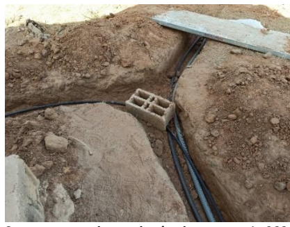
Scavo posa cavi energia elettrica – gennaio 2020