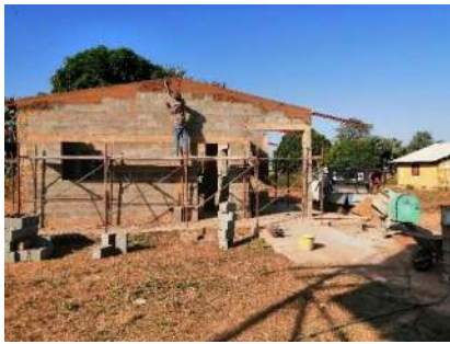
Preparazione per orditure tetto – dicembre 2019