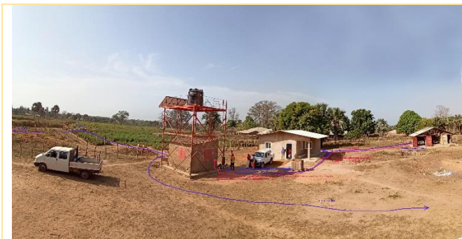
Panoramica traccia servizi – febbraio 2020