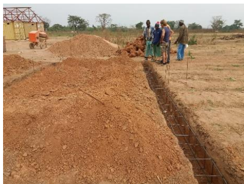
Posa gabbie per fondazioni - gennaio 2019