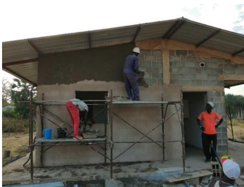
Intonaco esterno – gennaio 2020