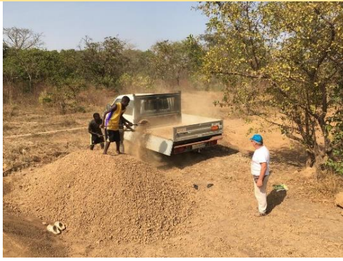
Trasporto materiale inerte – novembre 2019