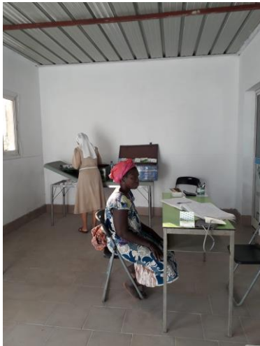
Presidio Sanitario Sur Silvia – 27 febbraio 2020