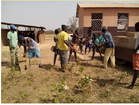
Arrivo materiale – gennaio 2019