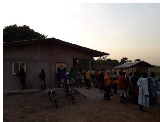
Incontro con gli uomini grandi del villaggio – 09 febbraio 2020