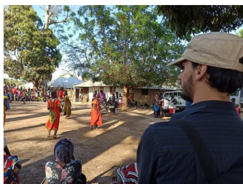
Festa delle Donne agricole – 09 febbraio 2020