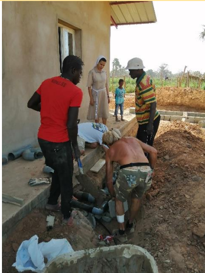
Raccordi scarico e carico acqua – gennaio 2020