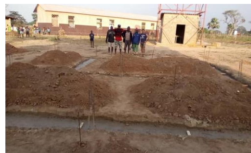
Getto fondazioni - gennaio 2019