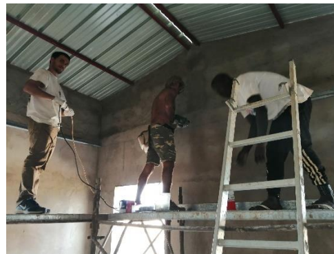
Posa contro soffittatura – gennaio 2020