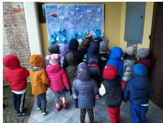
Centro Anziani Comune di Leini – dicembre 2019