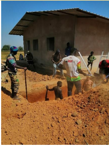
Scavo fossa biologica – gennaio 2020