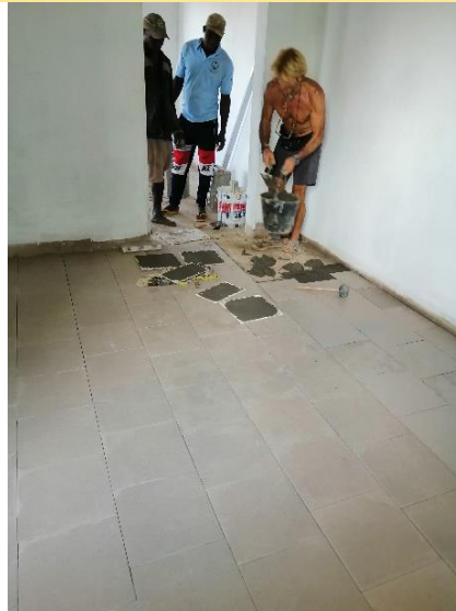
Posa pavimentazione – gennaio 2020