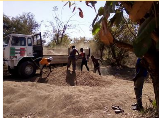
Materiale per la panimentazione - gennaio 2019