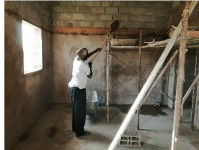
Intonaco Interno – gennaio 2019