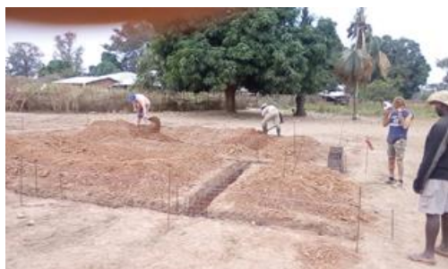
Armatura delle fondazioni - gennaio 2019