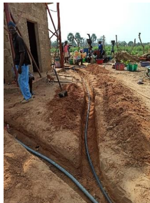
Scavo posa cavi energia elettrica e acqua – febbraio 2020