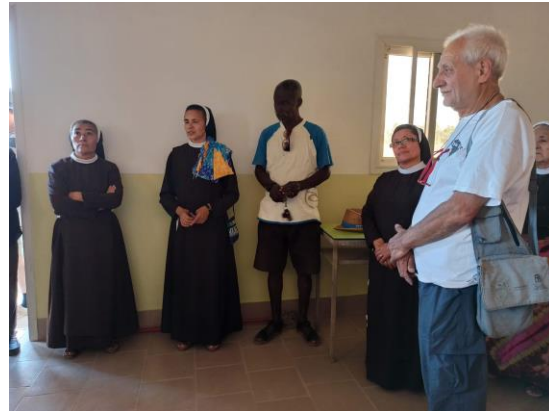
Consegna Presidio Sanitario – febbraio 09/02/2020