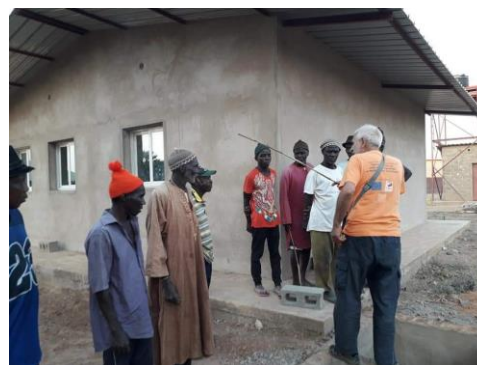
Informazione agli Uomini Grandi – 09 febbraio 2020