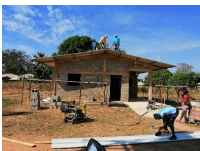
I lavori proseguono – gennaio 2020