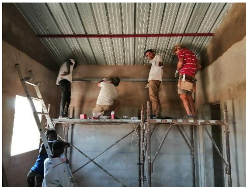
Posa contro soffittatura – gennaio 2020