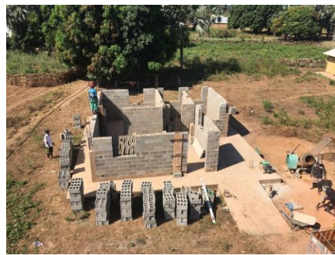
Avanzamento lavori – novembre 2019