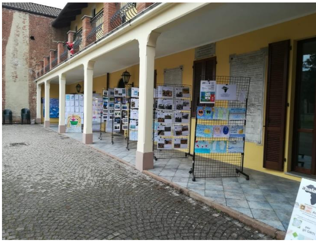
Centro Anziani Comune di Leini – dicembre 2019