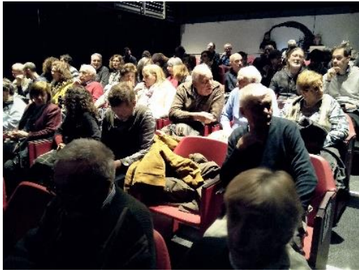
Teatro Civico L. Pavarotti - novembre 2019