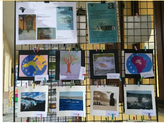
Centro Anziani Comune di Leinì – dicembre 2019