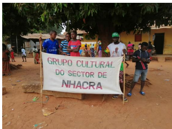
Gruppo teatrale di Nhacra – 09 febbraio 2020