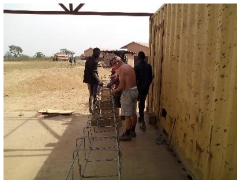
Preparazione gabbie per le fondazioni - gennaio 2019