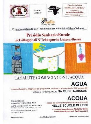
Centro Anziani Comune di Leini – dicembre 2019