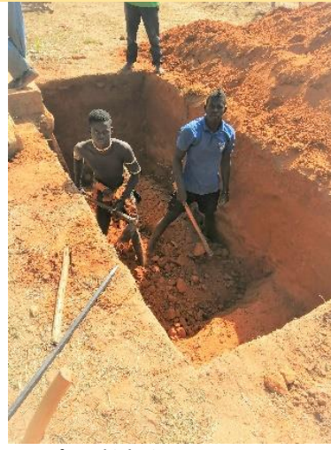
Scavo fossa biologica – gennaio 2020