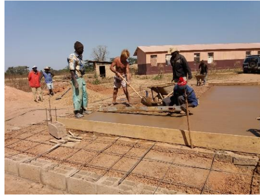
Getto pavimentazione – gennaio 2019