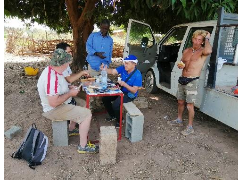
Pausa pranzo volontari – gennaio 2020