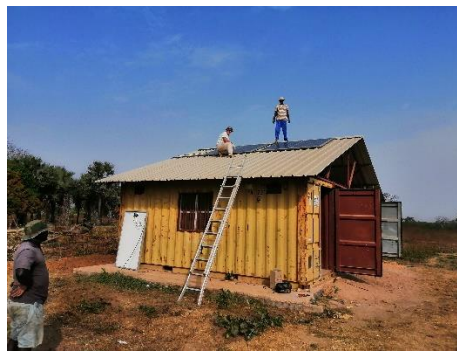
Posa pannelli fotovoltaici per presidio sanitario e scuola – gennaio 2020