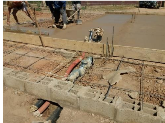
Scarichi acque nere e grige, ingresso acqua – gennaio 2019