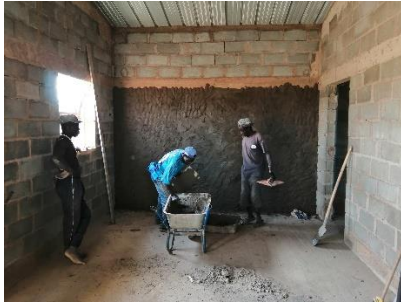
Intonaco Interno – gennaio 2019