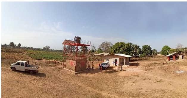
Panoramica – febbraio 2020