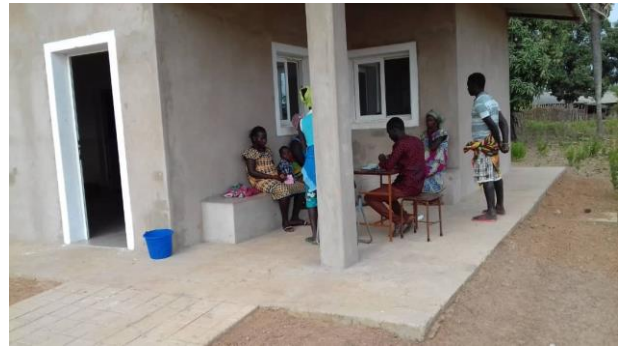
Presidio Sanitario attesa – 26 marzo 2020