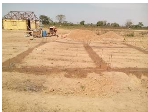
Squadratura e tracce fondazioni - gennaio 2019