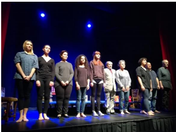
Teatro Civico L. Pavarotti "ITALIA DONATI, MAESTRA" 11 febbraio 2020