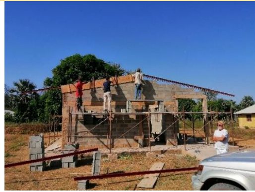
Armatura capriate – novembre 2019