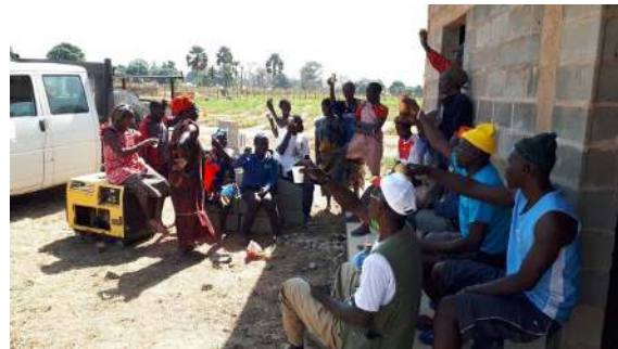
Pausa pranzo – dicembre 2019