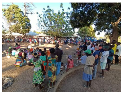
Festa delle Donne agricole – 09 febbraio 2020