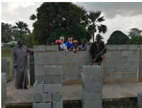
Ripresa lavori – novembre 2019