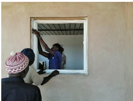
Montaggio serramenti – gennaio 2020