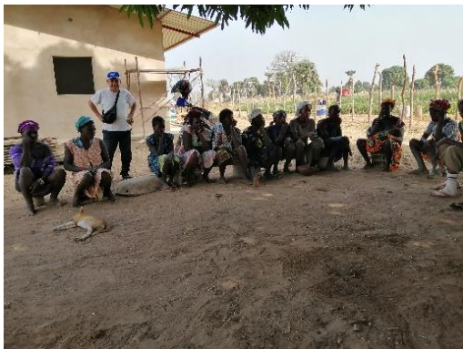
Incontro informativo – gennaio 2020