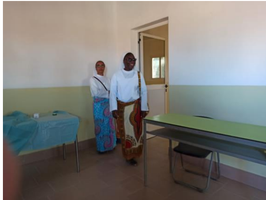
Consegna Presidio Sanitario – febbraio 09/02/2020