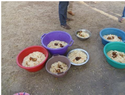
Pausa pranzo – dicembre 2019